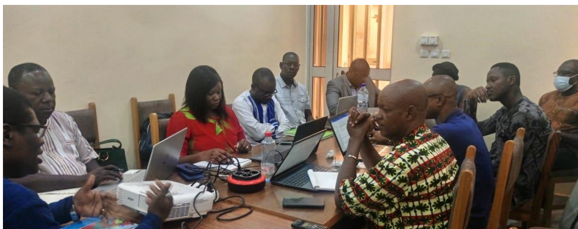
Les experts ont été formés pour être plus opérationnels sur le terrain

connaissances et expériences sur la MOPLT et sur le nexus HDP qui diffèrent dans les quatre (04) régions d'intervention du programme. Ce fut un moment de renforcement de la cohésion entre les travailleurs de la Cellule d'Appui à la Décentralisation et à la Participation Citoyenne (CADEPAC).