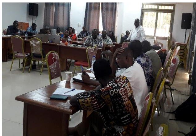
Les participants ont été formés sur la MOPLT et la gestion financière des projets

Le Consortium GAC à travers son unité opérationnelle, la CADEPAC, a organisé une formation sur la MOPLT, la gestion financière des projets du 19 au 21 juillet 2023, à Fada N'Gourma. C'était au profit de trente-et-un (31) acteurs