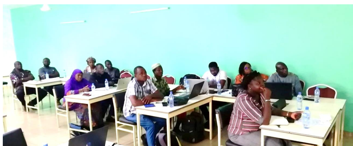
Les acteurs techniques des CT sont repartis outillés sur la MOPLT et l'instruction technique et financière des projets

Les acteurs techniques des CT ont également été sensibilisés sur leurs rôles et responsabilités dans le processus de mise en œuvre des projets à réaliser en marge de DEPAC-3.