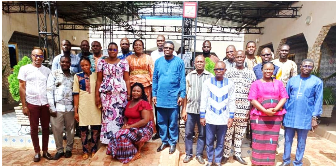
Photo de famille des participants à l'atelier

structures nationales concernées par cette thématique (DGCT et ADCT) conviennent d'une synergie.