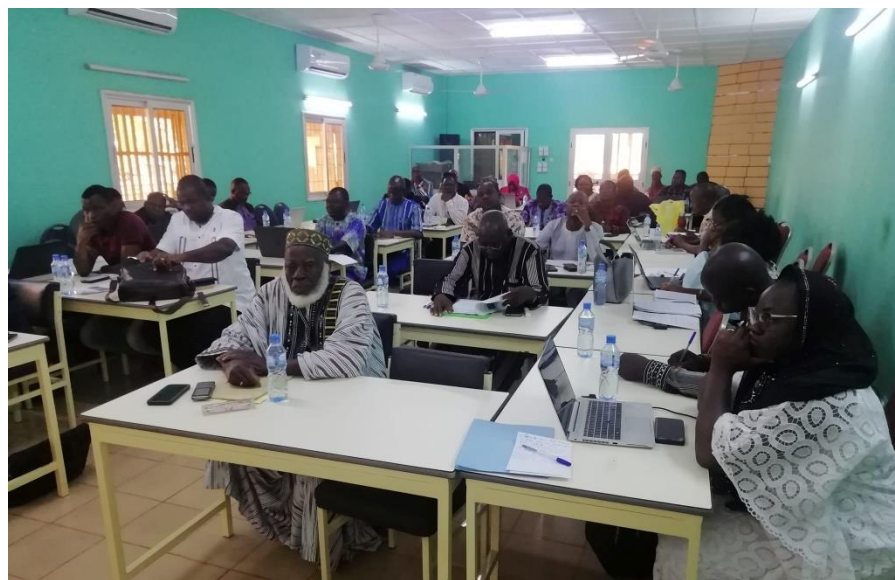
Le comité de suivi en plein examen du contenu de la S-DELCoT de la région du Nord

Après le lancement des travaux de validation de la Stratégie de Développement Economique et Cohérence Territoriale (S-DELCoT) de la région du Centre-Ouest, c'était au tour des acteurs de la région du Nord de valider leur document, du 22 au 23 mai 2023. La rencontre a réuni quarante participants (30 hommes et 10 femmes) pendant quarante-huit (48) heures. Au cours des travaux le comité de suivi a présenté la synthèse des travaux de l'atelier de Koudougou, examiné et amendé le contenu de la S-DELCoT de la région du Nord ; avant d'être validé par les parties prenantes. Aussi, ce fut le lieu de définir une feuille de route pour son adoption par la Délégation Spéciale Régionale.