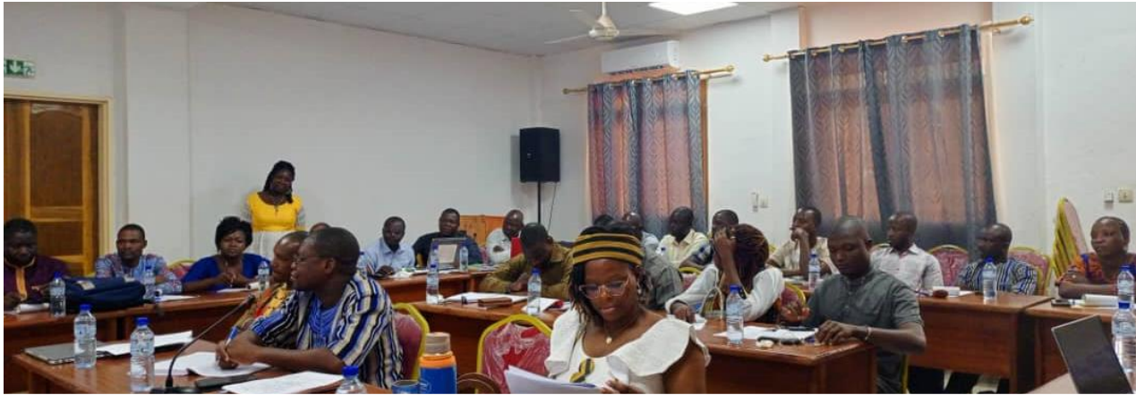
Les acteurs techniques des CT partenaires de la Tapoa et de la Gnagna, formés pendant 72h