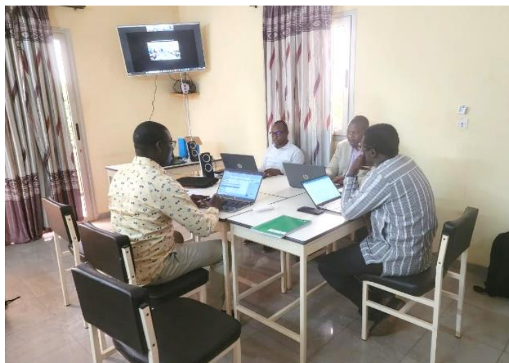
L'équipe de la CADEPAC a assuré la formation depuis Ouagadougou

Les acteurs locaux des collectivités territoriales partenaires de la CADEPAC, de la région du Sahel, ont vu leurs capacités renforcées sur la Maîtrise d'Ouvrage Public Local Total (MOPLT), du 08 au 10 Août 2023. La formation s'est faite par visioconférence à travers l'application ZOOM. Elle a regroupé le Président de la Délégation Spéciale de Dori,