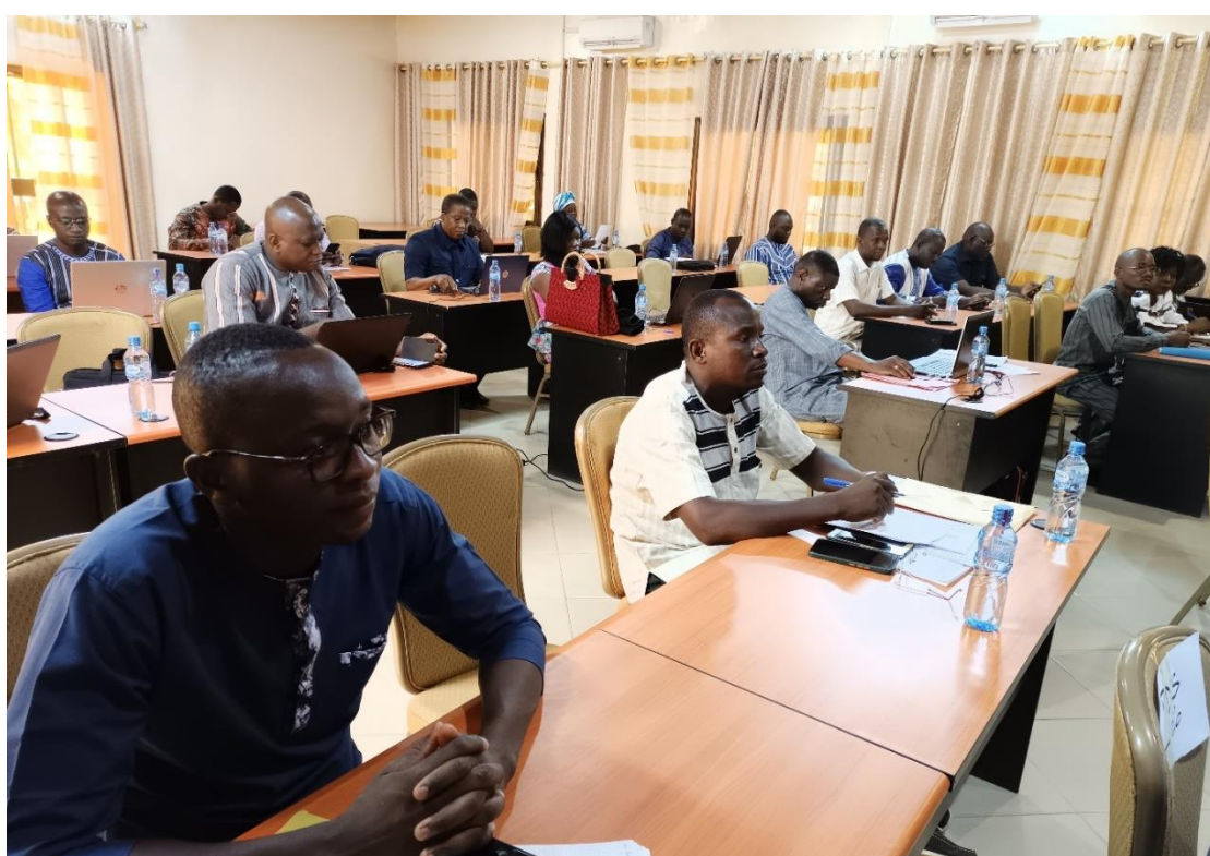
Les participants ont parcouru le rapport provisoire de la S-DELCoT du Centre-Ouest

du Centre-Ouest a été réexaminé les 22 et 23 mai 2023 dans la Commune de Réo, Province du Sanguié. Cet atelier a permis de relancer le processus d'élaboration de la S-DELCoT de la région du Centre-Ouest, d'examiner le rapport provisoire du document, de faire