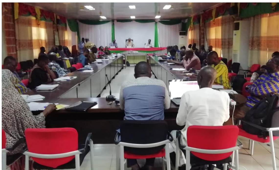
La S-DELCoT du Nord a été adoptée à l'unanimité par la délégation spéciale régionale

création d'emplois, le développement des infrastructures de soutien à la promotion des filières et la promotion de la cohérence territoriale et la gouvernance dans un environnement de sécurité et de paix. En rappel, son