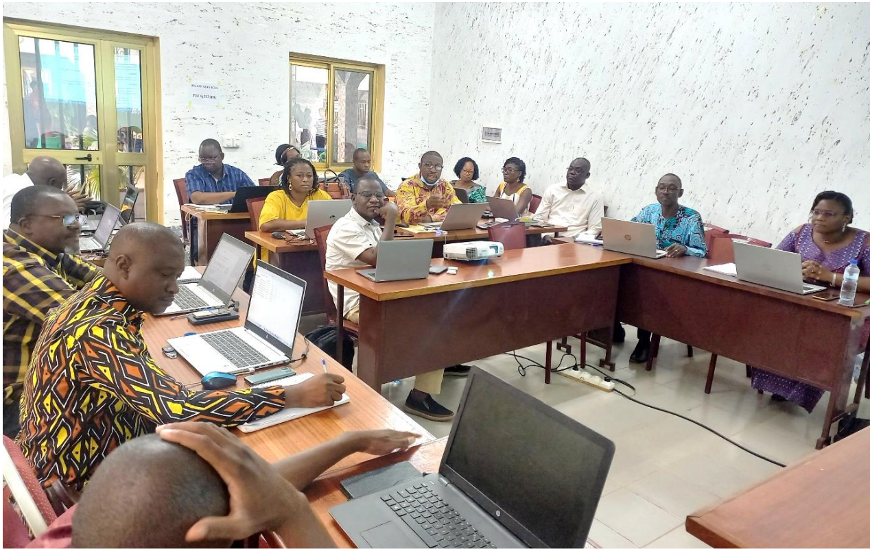
Le projet d'arrêté a été passé au peigne fin par les participants

L'atelier s'intègre dans une vision de mutualisation de bonnes pratiques de l'ADCT des projets et programmes pour la production d'un référentiel national. Les innovations portées par la CADEPAC lors de la mise en œuvre des deux premières phases du programme décentralisation et participation citoyenne (DEPAC), financé par la Coopération Suisse s'inscrivent dans cette dynamique. Parmi ces innovations, il y a la démarche d'auto-évaluation qui est une approche innovante de mesure des performances des Collectivités Territoriales, développée dans sa zone d'intervention, en vue de permettre à ces CT de prendre de bonnes décisions pour améliorer la gouvernance locale.