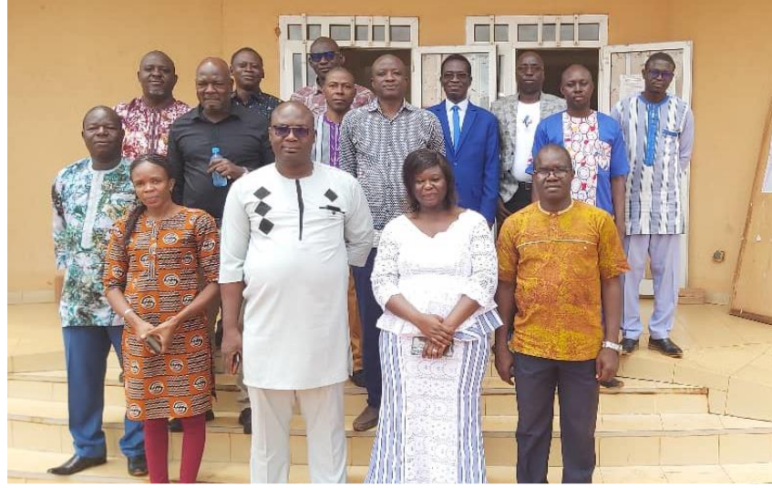
Photo de famille des participants

La Direction Générale des Collectivités Territoriales (DGCT) a tenu un atelier de finalisation du module de formation sur la Maîtrise d'Ouvrage Public Local (MOPL), du 7 au 12 août 2023, à Koudougou. Cet atelier constitue la troisième étape du processus d'élaboration du module de formation sur la MOPL au profit des acteurs de la décentralisation. Il a connu la participation de la DGCT, l'ADCT, l'AMGT, l'ACOMOD, l'AMBF, l'ARBF, la DGCMEF, entre autres.