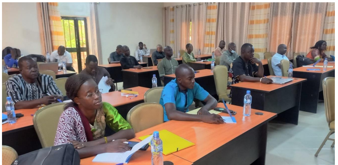
Les participants ont pu s'approprier les outils techniques et financiers liés à la MOPLT

l'approche Humanitaire-Développement-Paix (HDP). L'atelier s'est tenu dans le cadre de la mise en œuvre du DEPAC-3, financé par le Coopération suisse.