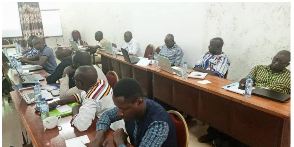
Les participants ont pu relever les points forts et les insuffisances des formations passées avant de faire des recommandations pour celles à venir

l'équipe opérationnelle du Consortium GAC et les inter collectivités ; toutes parties prenantes des sessions de formation.