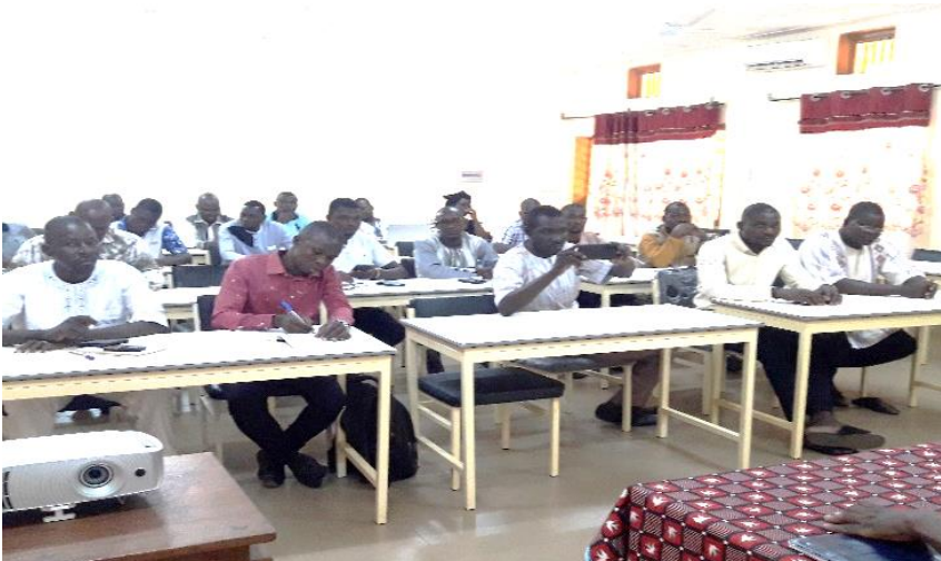
L'atelier d'informations et de formations des acteurs de la Tapoa et de la Gnagna

A travers ces ateliers, les participants ont pu s'approprier de l'approche d'accompagnement développée par le Consortium GAC dans la mise en œuvre de l'axe 2 du DEPAC-3, ainsi que les rôles et responsabilités de chaque acteur dans l'exercice de la MOPLT, en lien avec les contextes sécuritaire et humanitaire dans la région de l'Est.