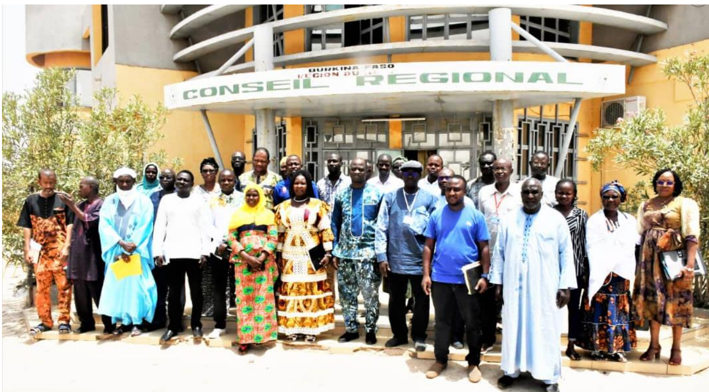
Photo de famille des participants avec les représentants des trois (3) mandataires du DEPAC-3

Les axes d'intervention de la CADEPAC et ceux des deux (02) autres mandataires ont également été présentés. En prélude à ce lancement, une délégation des mandataires du DEPAC-3 a rendu visite au Président de la Délégation Spéciale (PDS) régionale du Sahel et au premier vice-président de la délégation spéciale de la commune de Dori, le 16 mai 2023.