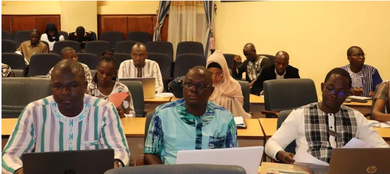
Les participants ont procédé à la validation du projet de décret

Il ressort que le projet de décret comporte quarante-quatre (44) articles regroupés en onze (11) chapitres qui traitent des dispositions générales, du cadre de gouvernance, de la planification des projets, de la procédure de passation, de l'offre spontanée, de la signature et de l'approbation des contrats, du bouclage financier et démarrage des travaux et de l'exploitation, du contenu et exécution du contrat, des modalités de gestion et de contrôle du contrat, du règlement des différends ainsi que dispositions spécifiques et finales.