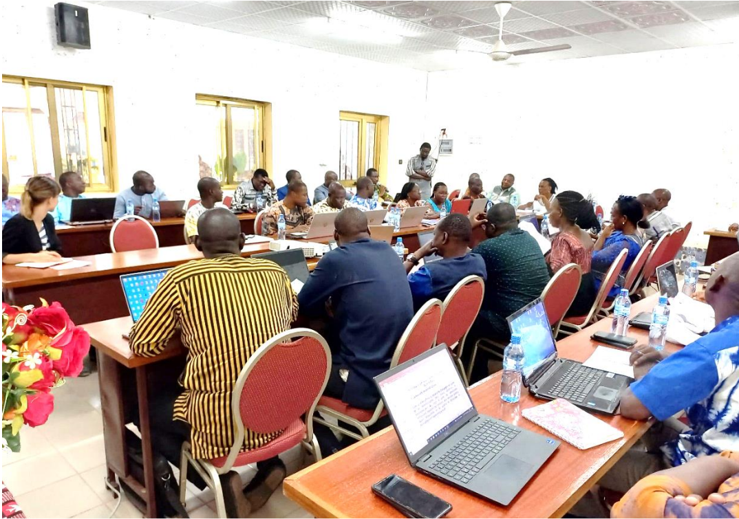
Les participants en séance d'échanges à l'issue de la présentation des innovations

La Cellule d'Appui à la Décentralisation et à la Participation Citoyenne (CADEPAC) a tenu un atelier de partage des innovations portées par les mandataires du programme DEPAC, avec les structures du Ministère de l'Administration Territoriale, de la Décentralisation et