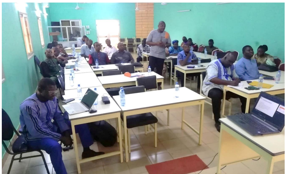
Les participants sont repartis outillés sur la MOPLT en lien avec le nexus HDP

C'était le lieu pour les trente-huit participants (30 hommes et 08 femmes) de connaître leur rôle dans le processus de mise en œuvre des activités de développement local dans ce contexte sécuritaire et humanitaire difficile.