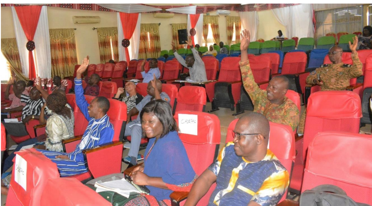
Les membres de la délégation spéciale régionale du Centre-Ouest ont adopté la S-DELCoT

La stratégie de la région du Centre-Ouest est forte de quatorze (14) projets et pèse plusieurs centaines de milliards. Ces projets sont en lien avec l'aménagement de 1 000 ha de bas-fond pour la production céréalière, l'installation d'unités de transformation de la tomate, de jus de fruits et de tubercules, l'installation de chaînes de valorisation de la filière volaille, du coton et de promotion du textile ainsi que l'installation d'une unité d'homogénéisation du beurre de karité. Il faut noter que des partenaires au développement s'inspirent déjà des résultats de cette stratégie dans la programmation de leurs activités, selon le secrétaire général du conseil régional.