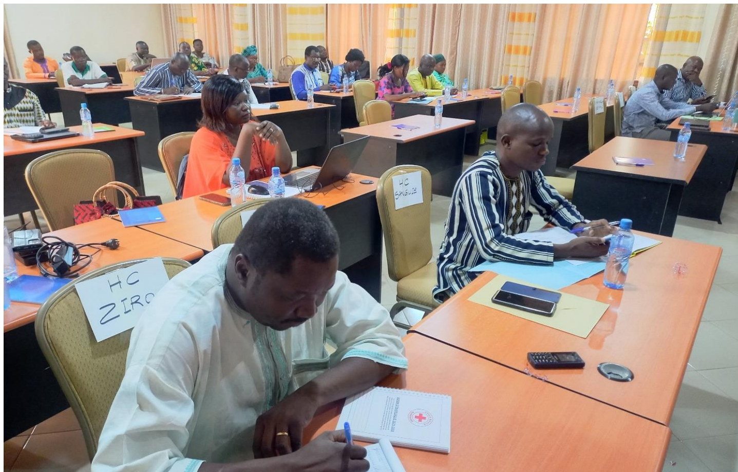
Les participants ont pu cerner les contours de la MOPLT en lien avec le nexus HDP

Développement et Paix), qui constitue l'un des défis du moment.