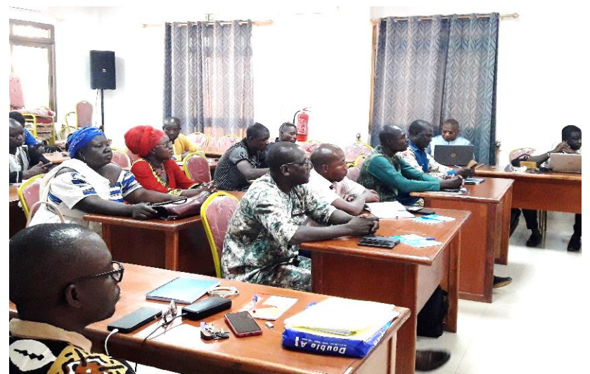
... les acteurs du Gourma

capacités des acteurs locaux des CT partenaires de l'Est renforcées sur les principes d'intervention, l'organisation et les approches développées par le programme DEPAC-3. Un accent particulier a été mis sur les types d'accords existants entre l'Etat, les mandataires et la