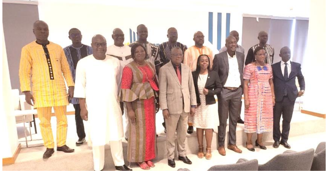
Photo de famille de la délégation burkinabè et rwandaise

ainsi que la politique de décentralisation fiscale et les mécanismes de financement des collectivités locales.